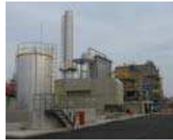
焼却を開始したストーカ炉 (100t/日)

もう一基のストーカ炉が6月1日より焼却を開始しました。となりのキルン炉に比べるとずいぶん小さい焼却炉ですが、1日に100tの木くずを燃やす事ができます。6月からは、キルン炉と合わせて1日に300tの可燃物を燃やしていきます。