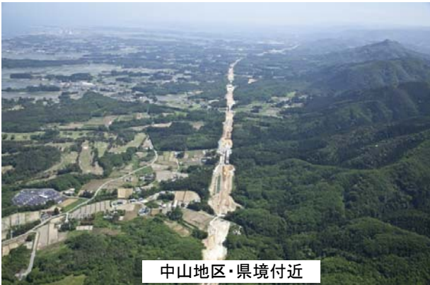
中山地区・県境付近

県境～山元IC間においては、平成26年度内の開通目標に向けて、工事を進めています。土工工事や橋梁工事に引き続き、今年度は舗装・施設工事が順次発注されます。（撮影日は平成25年5月31日）