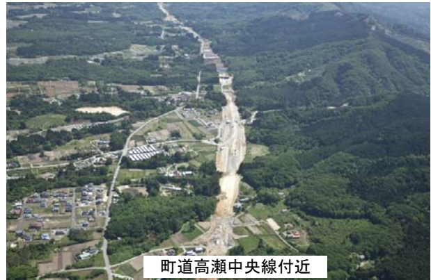
町道高瀬中央線付近