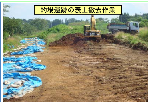
的場遺跡の表土撤去作業