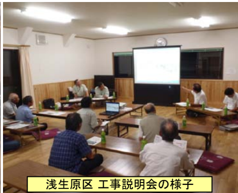
浅生原区 工事説明会の様子