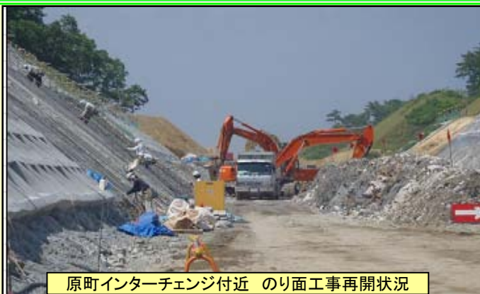
原町インターチェンジ付近 のり面工事再開状況

東日本大震災により常磐富岡IC以北の建設工事や調査等を一時中止していましたが、警戒区域を除いた南相馬市小高区～山元IC間について5月中旬より事業を再開しました。