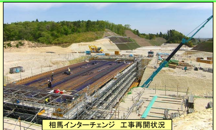
相馬インターチェンジ 工事再開状況