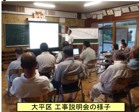
大平区 工事説明会の様子