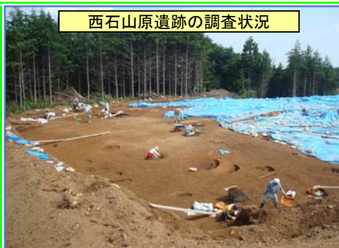
西石山原遺跡の調査状況

宮城県と山元町への委託により6月中旬から調査を再開しました。昨年行った西石山原遺跡を引き続き調査し、今年新たに的場遺跡の調査に着手しました。今後工事区間全般について発掘調査を進めていきます。