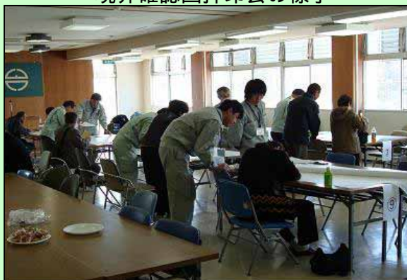
境界確認図押印会の様子