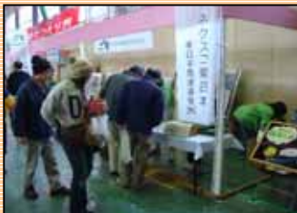
弊社コーナーの様子

nexco東日本コーナーを開設し、常磐自動車道のPRやアンケート調査、弊社マスコットのハッピー君との記念撮影、除雪車のペーパークラフト製作等を楽しんでいただきました。