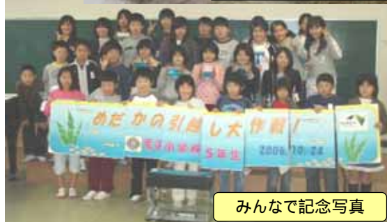
みんなで記念写真