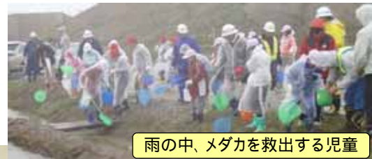
雨の中、メダカを救出する児童

児童たちがメダカを上手に育てて、たくさん繁殖させ、きっと来年の春にはメダカを元の場所に放流できるものと期待しています。