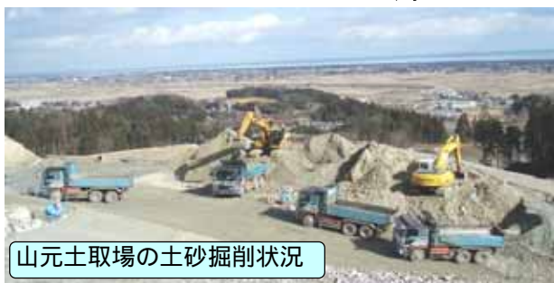
山元土取場の土砂掘削状況