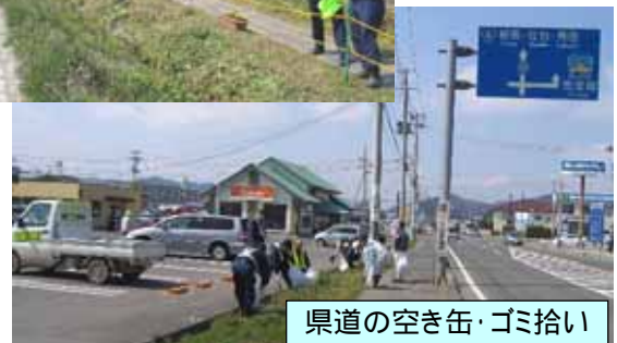
県道の空き缶・ゴミ拾い