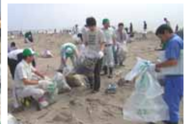
400名のボランティアが参加