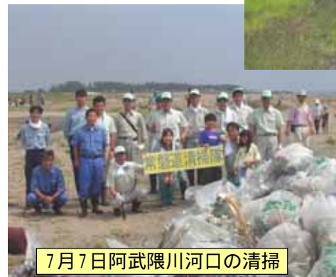
7月7日阿武隈川河口の清掃

7月7日(土)、第10回ボランティア活動として、亘理町の一斉清掃に参加しました。当安全協議会の19名は阿武隈サミットが主催する阿武隈川河口の清掃を行い、砂地に埋まったペットボトルや空き缶を掘り出し、中の砂をかき出して約1時間作業しました。朝早く遠方の福島県から参加する児童が多く、地域の環境・社会貢献意識の高さを感じました。