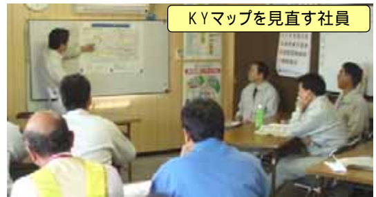
KYマップを見直す社員

常磐道の工事は、土運搬路KY(危険予知)マップを作成してダンプトラック運転手への安全運転指導を行ってきましたが、5月23日(水)、安全協議会(NEXCO社員17名、工事請負人8名)では走行ルートの危険箇所を再点検し、土運搬路KYマップの見直しを行いました。現在、鳥の海工事では、この土運搬路KYマップを使用し、ダンプ運転手に安全指導を行って、土砂運搬作業を実施しています。 地域の皆様のご協力をお願い致します。