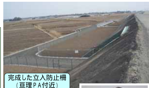
完成した立入り防止柵 (亘理PA付近)

また、立入り防止柵は高速道路敷地内へのゴミ等の投げ捨て防止も兼ねていますので、橋の下にも設置しています。