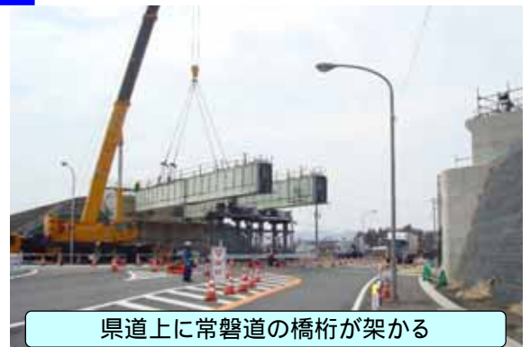
県道上に常磐道の橋桁が架かる

また、完成前に材料などの落下防止のため設置している防護工を取り除くため、もう一度片側交互規制を行いますので、地域の皆様のご協力をお願い致します。