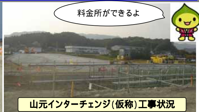
山元インターチェンジ(仮称)工事状況