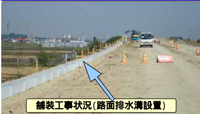
舗装工事状況(路面排水溝設置)