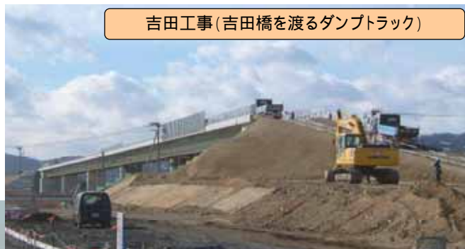
吉田工事(吉田橋を渡るダンプトラック)

雪の日も・風の日も・寒い日も、工事現場はがんばります！地域の皆様のご協力をお願いします。