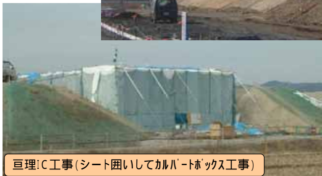
亶理IC工事(シート囲いしてカルバートボックス工事)