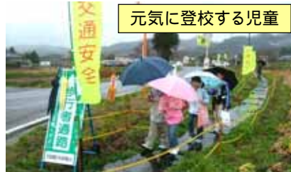
元気に登校する児童