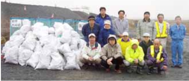
県道から収集した空き缶・ゴミと参加メンバー

安全協議会では、地域に根ざした高速道路を建設する会社として、清掃活動等のボランティア活動を継続しますので、地域で清掃を要望する場所がありましたら(編集責任者 山田)へご連絡頂ければ幸いです。