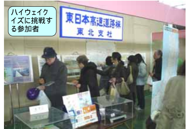
ハイウェイクイズに挑戦する参加者

クイズの中で「常磐道山元～亘理間を建設している会社の名前は何か?」という問題に、600名中約100名の方が日本道路公団と回答していました。(正解は東日本高速道路株式会社です)