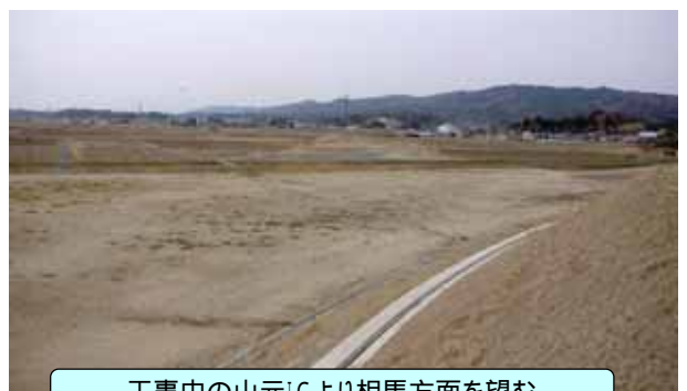
工事中山元ICより相馬方面を望む