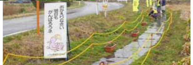
通学歩道のフラワーポットと交通安全のぼり旗設置