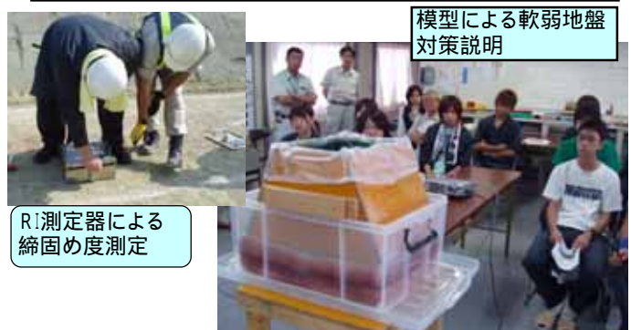
模型による軟弱地盤対策説明

平成18年7月26日(水) 園芸専門学校1年生11名 常磐道の環境・景観対策取組み事例の紹介、模型による軟弱地盤対策の説明、盛土工事の施工体験。