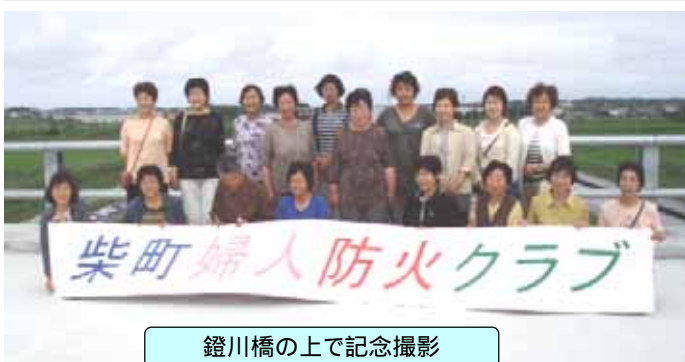
鏡川橋の上で記念撮影

平成18年7月19日(水) 柴町婦人防火クラブ16名 高速道路トンネルの防火設備説明、施工機械の試乗体験。